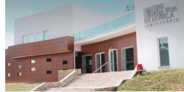
Centro de Ciência Viva do Alviela Carsoscópio

Na região pode ainda visitar outras grutas de grande beleza natural como: Grutas da Moeda; Grutas de Santo António; Grutas de Alvados; Grutas das Lapas; Gruta do Algar do Pena.