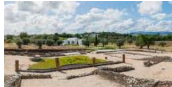
Vila de Cardílio

Encontra-se aberto de terça a domingo, encerrado às segundas-feiras. Das 10h às 12h30 e das 14h às 18h, exceto ao sábado e domingo em que encerra às 20h