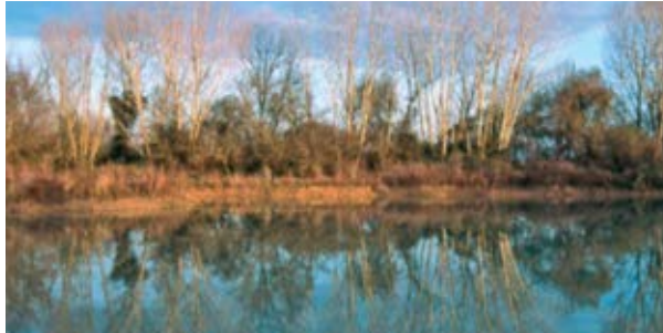
Reserva Natural Paúl do Boquilobo

Situado a cerca de 7km de Torres Novas, perto da confluência dos rios Almonda e Tejo, o Paul é uma zona húmida, rica em aves, em particular colónias de garças e anatídeos, e em flora, destacando-se os maciços de salgueiros, plantas aquáticas e caniçais.