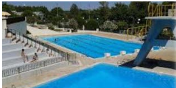
PISCINAS MUNICIPAIS DE ALCANENA

Os hóspedes do Hotel Eurosol Alcanena podem usufruir gratuitamente das piscinas municipais (contíguas ao hotel).