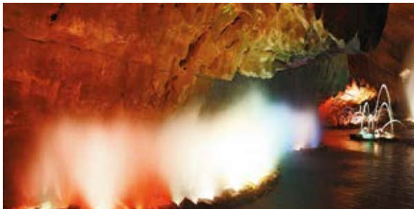
Grutas de Mira d'Aire

A singular localização do Castelo torna-o um dos mais bonitos monumentos do país, tendo sido considerado Monumento Nacional em 1910.