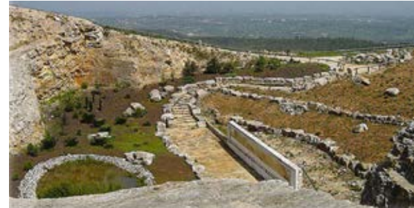
Monumento Natural das Pegadas dos Dinossauros

Deve a sua formação a um lago, que estaria em comunicação com a Bacia Terciária do Tejo e para o qual seriam conduzidas as águas. No inverno, esta depressão transforma-se num imenso lago, alimentado pelas galerias subterrâneas que, a transbordar, a inundam, por vezes durante vários meses. É um fenómeno raro, de grande interesse científico, constitui, igualmente, um fenómeno natural de beleza invulgar.