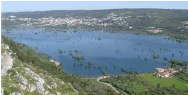
Polje de Minde

Este “santuário” natural, classificado como Reserva Natural desde 1980, integra, igualmente, a Rede de Reservas da Biosfera (UNESCO) e a Lista de Zonas Húmidas de Importância Internacional (Convenção de RAMSAR) desde 1981 e 1996, respetivamente.