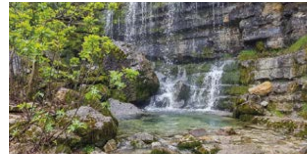
Parque Natural de Serra de Aires e Candeeiros

O Parque Natural das Serras de Aire e Candeeiros é considerado um paraíso para os amantes da espeleologia que nas suas profundezas poderão descobrir grutas e algares, com formações surpreendentes esculpidas pela água e pelo tempo. À superfície, não se avistam rios nem ribeiras e a paisagem é agreste, marcada aqui e ali por rochas, falhas e escarpas. Apesar disso, a fauna é muito rica e variada, destacando-se as 18 espécies de morcegos (símbolo do Parque) que encontram o abrigo ideal nas diversas grutas.