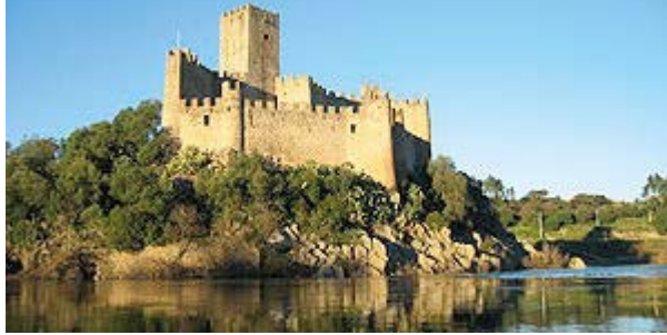
Castelo de Almourol

Fortaleza reconstruída por Gualdim Pais, mestre da Ordem dos Templários, em 1171, é o ícone do Concelho de Vila Nova da Barquinha.